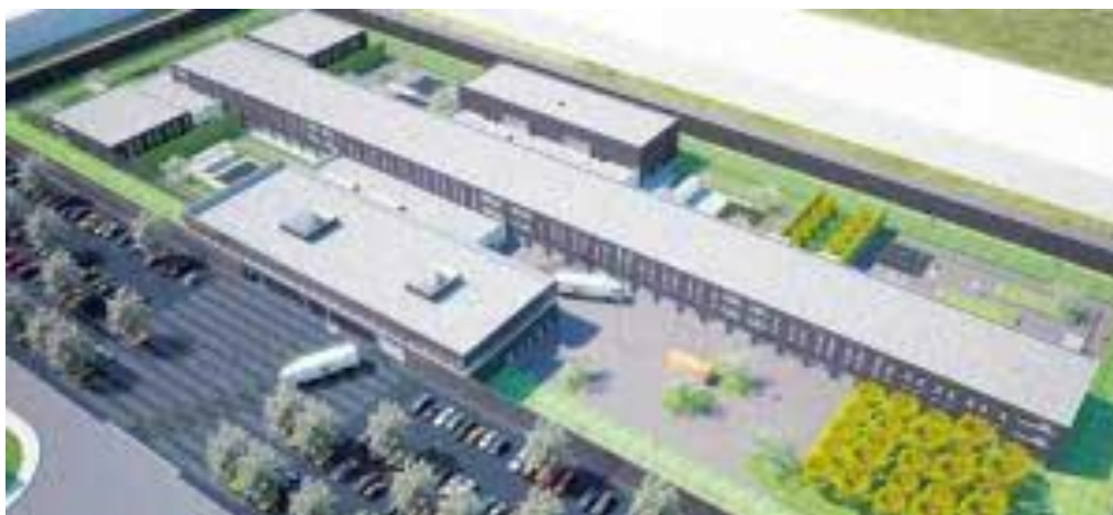
Afbeelding 1. Overzichtsfoto DCR

Het DCR is in 2010 gebouwd ten behoeve van vreemdelingenbewaring 7 . Het gebouw is echter zodanig ingericht dat verschillende doelgroepen en de wisselende vraag naar capaciteit binnen DJI opgevangen kunnen worden. Het DCR huisvestte in de periode 2010-2016 verschillende doelgroepen. Vanaf 18 oktober 2015 tot en met